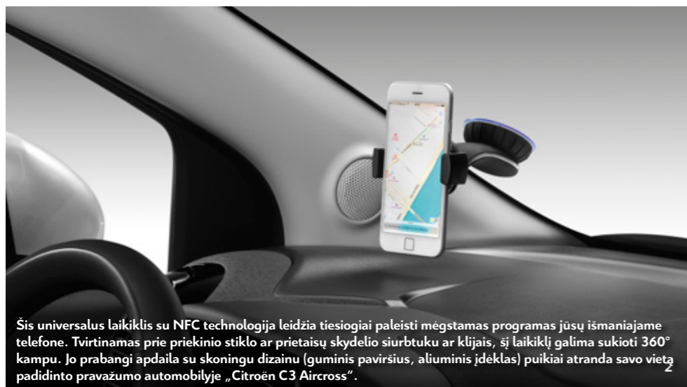
Šis universalus laikiklis su NFC technologija leidžia tiesiogiai paleisti mėgstamas programas jūsų išmaniajame telefone. Tvirtinamas prie priekinio stiklo ar prietaisų skydelio siurbtuku ar kljais, šį laikiklį galima sukroti 360° kampu. Jo prabangi apdaila su skoningu dizainu (guminis paviršius, aliuminis įdėklas) puikiai atranda savo vietą padidinto pravažumo automobilyje „Citroën C3 Aircross“.