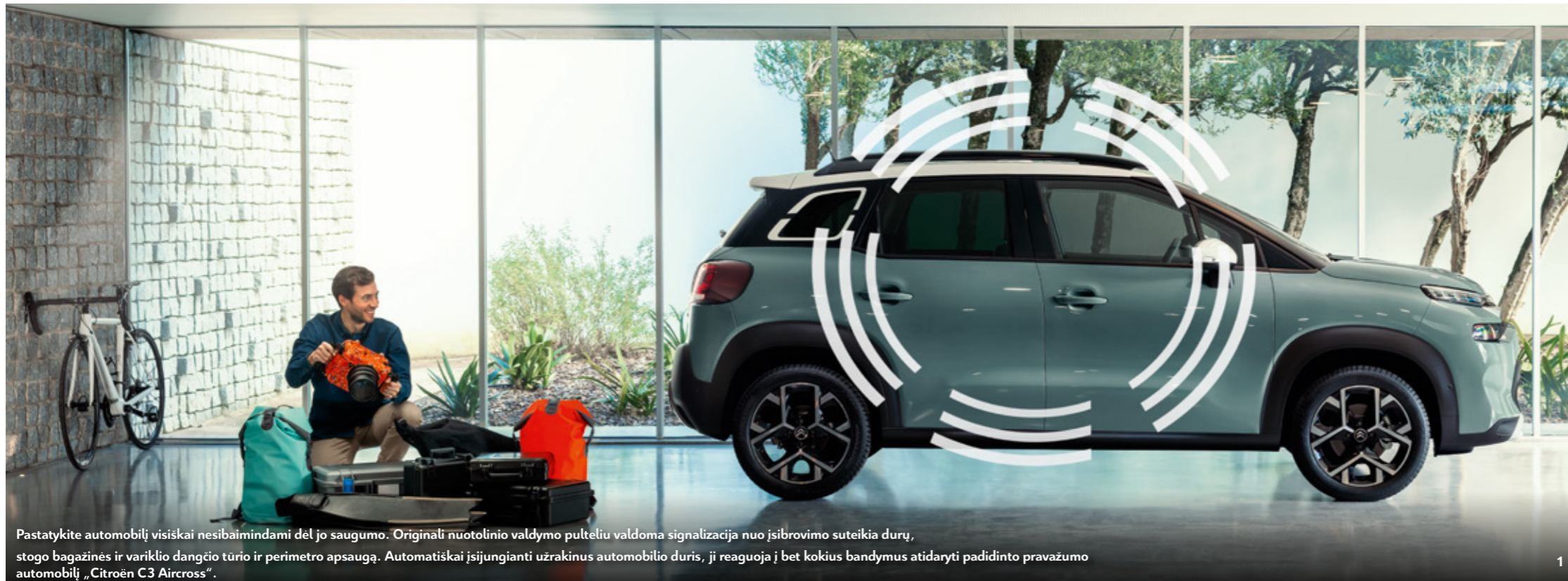
Pastatykite automobilį visiškai nesibaikindami dėl jo saugumo. Originali nuotolinio valdymo pulteliu valdoma signalizacija nuo įsibrovimo suteikia durų, stogo bagažinės ir variklio dangčio tūrio ir perimetro apsaugą. Automatiškai įsijungianti užrakinus automobilio duris, ji reaguoja į bet kokius bandymus atidaryti padidinto pravažumo automobilį „Citroën C3 Aircross“.