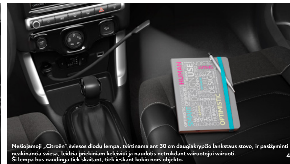
Nešiojamoji „Citroën“ šviesos diodų lempa, tvirtinama ant 30 cm daugiakrypčio lankstaus stovo, ir pasižyminti neakinančia šviesa, leidžia priekiniam keleiviui ja naudotis netrukdant vairuotojui vairuoti. Ši lempa bus naudinga tiek skaitant, tiek ieškant kokio nors objekto.