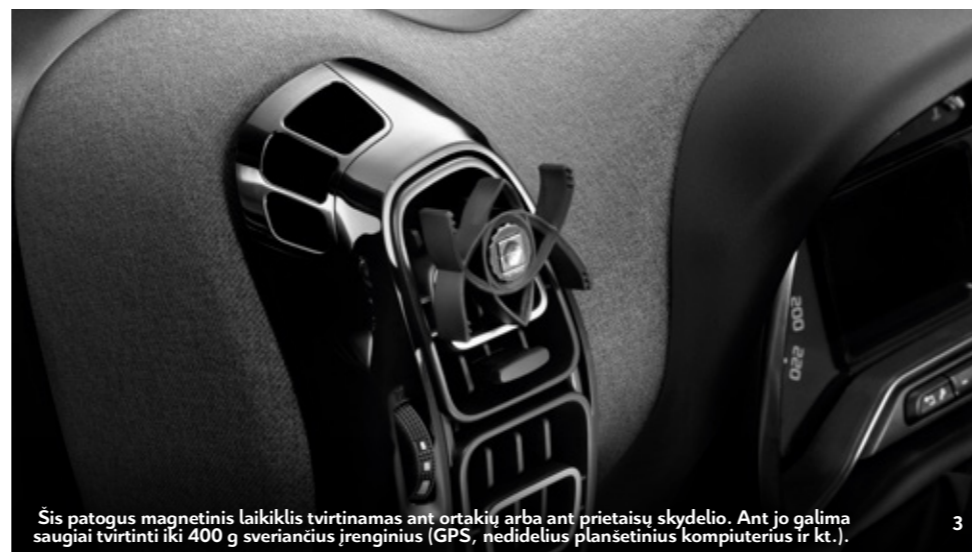
Šis patogus magnetinis laikiklis tvirtinamas ant ortakių arba ant prietaisų skydelio. Ant jo galima saugiai tvirtinti iki 400 g sveriančius įrenginius (GPS, nedidelius planšetinius kompiuterius ir kt.).